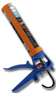
Kartuschenpresse Ultra-Press Art.-Nr. 906 3310