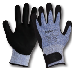
Arbeitsschutzhand- schuh - cut - Art.-Nr. 905 020 2xx