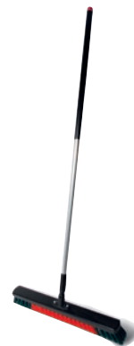
Werkstattbesen Art.-Nr. PZ-110-665 Aluminiumstiel Art.-Nr. PZ-140-1505