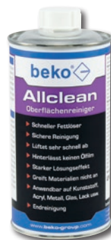
Allclean Oberflächenreiniger Art.-Nr. 266 120 0500